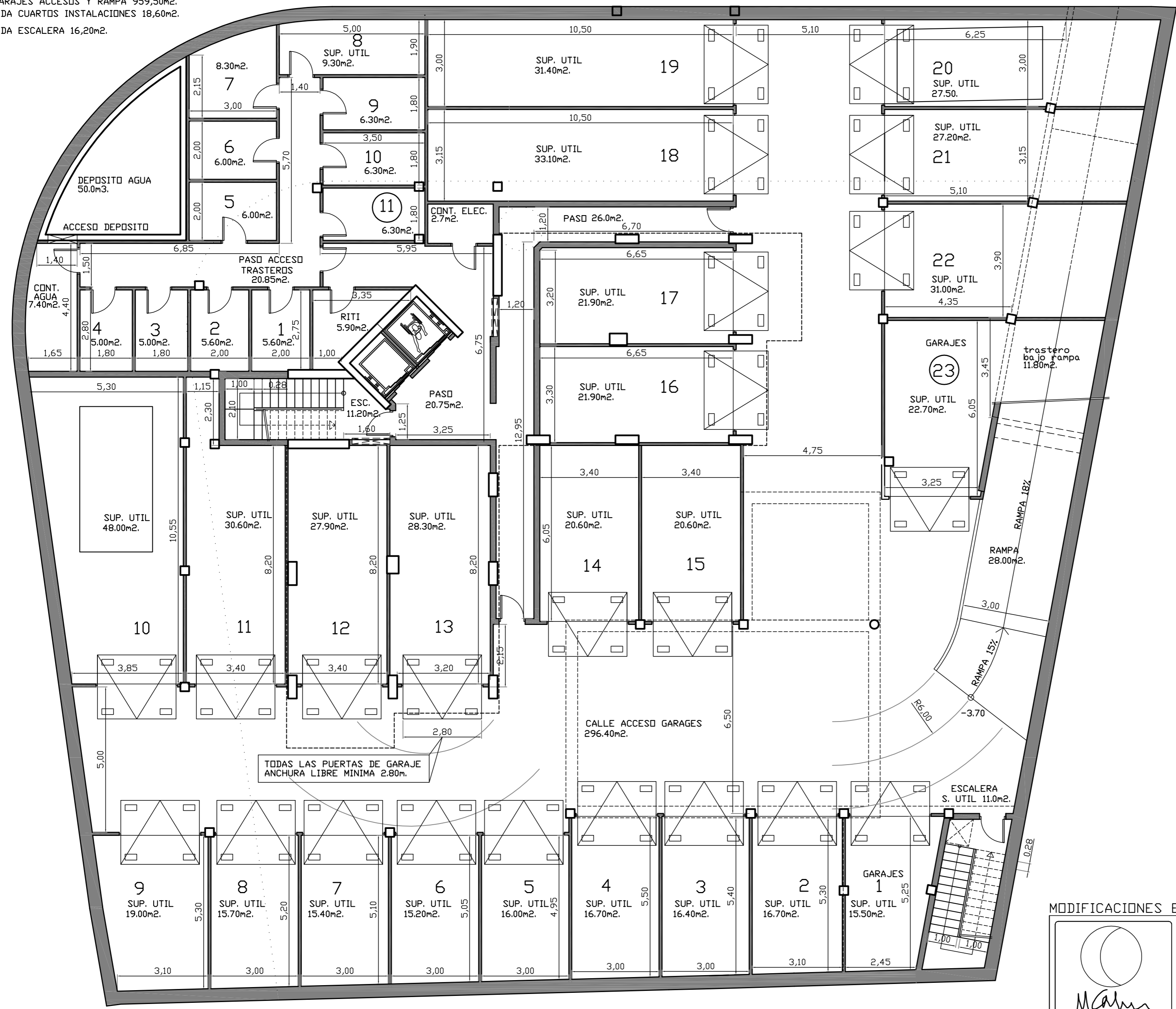
PLANTA SOTANO TOTAL SUPERFICIE CONSTRUIDA 1.200,0m 2 .

SUP. CONST. GARAJES ACCESOS Y RAMPA 959,50m 2 . SUP. CONSTRUIDA CUARTOS INSTALACIONES 18,60m 2 . SUP. CONSTRUIDA ESCALERA 16,20m 2 .